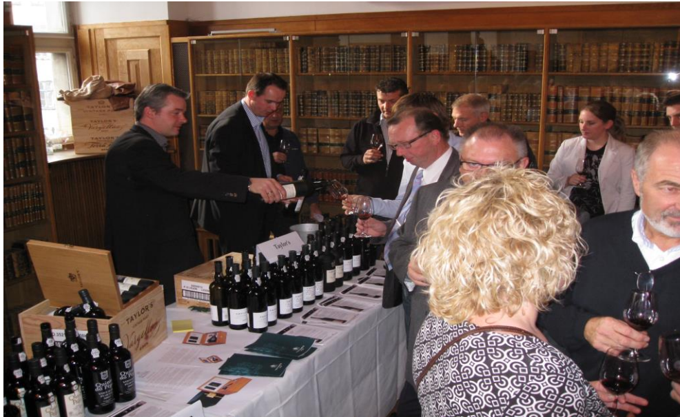
Typisk scene fra portvinsfestivalen på Børsen - her Taylor's stand 2012

Scandic i Roskilde, hvor den finder sted lørdag den 5. marts. Også her har vi fået tilbudt billetter til særlig klubpris, hvilket vi vil orientere om snart.