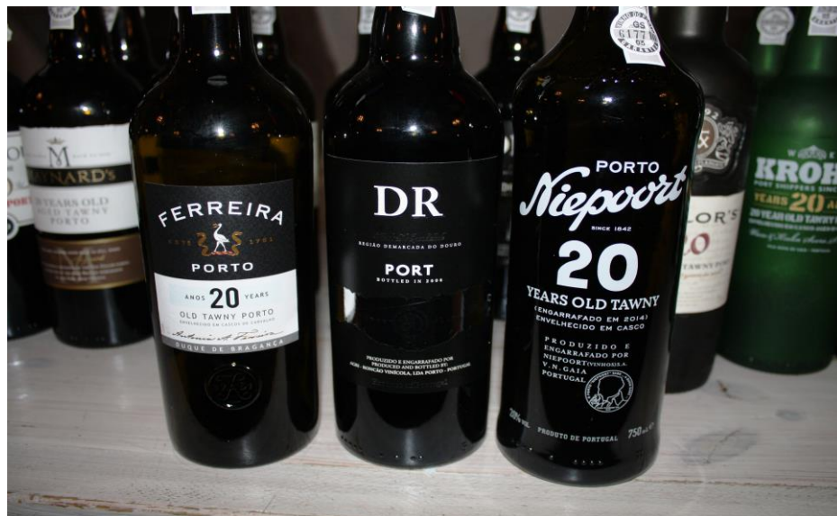
Top tre fra den helt blinde smagning af 20 Years Old Tawny 2015

Klubbens generalforsamling fandt sted den 29. april 2015. I den forbindelse blev der smagt 20 års Tawny. Programmet havde 14 forskellige vine, men da flaskerne fra Noval desværre ikke kom frem til tiden, endte vi med 13.